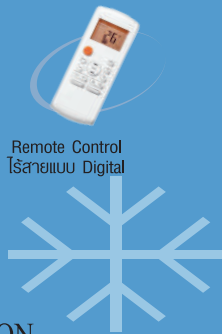
Remote Control ไร้สายแบบ Digital