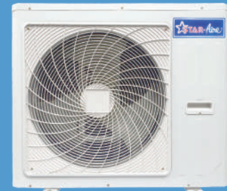
Model CR-45 - CR-48