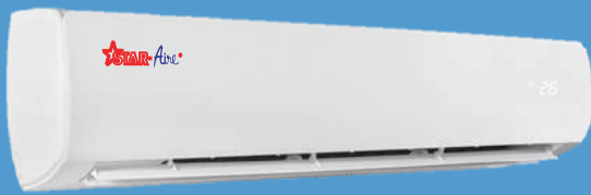
Model : DW-45A - DW-48A