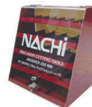
ชุดดอกสว่าน L520 ระบบเมตริก