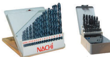
ชุดดอกสว่าน L501 ระบบนิ้ว