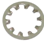
แหวนจักรใน SUS304 AW