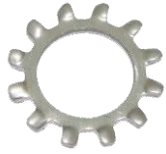
แหวนจักรนอก SUS304 BW

โทร. 02-214-0101 แฟกซ์. 02-214-0202 www.kvsengineer.com