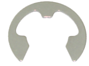
แหวนตัว E SUS304 ETW