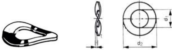
แหวนคลีน (WW)

โทร. 02-214-0101 แฟกซ์. 02-214-0202 www.kvsengineer.com