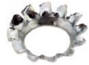
แหวนจักรเตเปอร์ CW