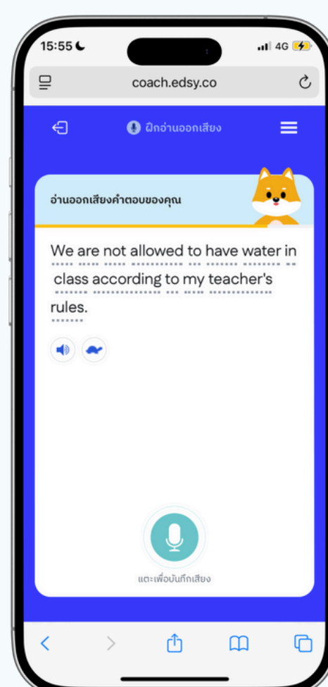
โปรแกรม Edsy AI Coach