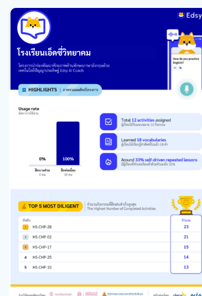
รายงานผลลัพธ์โครงการ