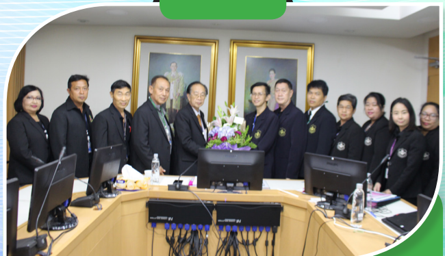
คณะกรรมการและฝ่ายจัดการมอบดอกไม้ให้กำลังใจ สหกรณ์ออมทรัพย์จุฬาลงกรณ์มหาวิทยาลัย จำกัด เมื่อวันที่ 24 พฤษภาคม 2560