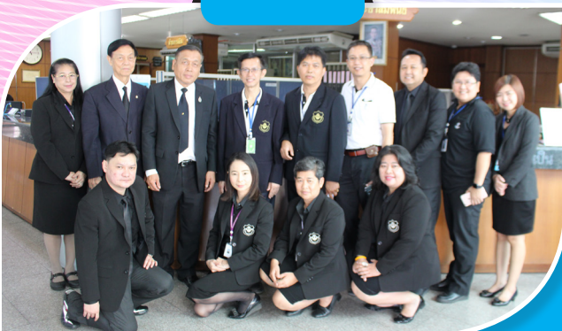
ชุมนุมสหกรณ์ออมทรัพย์แห่งประเทศไทย จำกัด ตรวจประเมินสหกรณ์คุณภาพมาตรฐาน เมื่อวันที่ 8 พฤษภาคม 2560