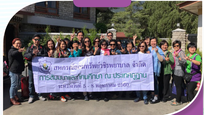
สัมมนาและทัศนศึกษาประเทศภูฏาน ระหว่างวันที่ 5 - 8 พฤษภาคม 2560