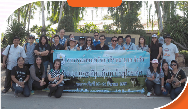
สัมมนาและทัศนศึกษาโครงการชิงหัวมัน ตามพระราชดำริ จ.เพชรบุรี ระหว่างวันที่ 25 - 26 มีนาคม 2560