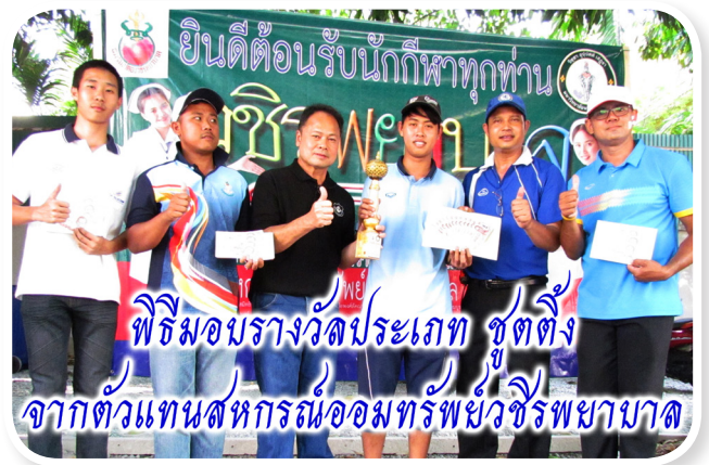
พิธีมอบรางวัลประเภท ชูตติง จากตัวแทนสหกรณ์ออมทรัพย์วชิรพยาบาล