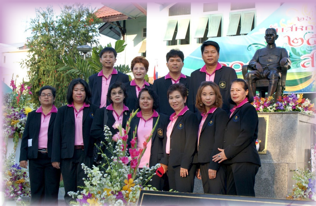
คณะกรรมการและฝ่ายจัดการ ร่วมวางพวงมาลาในวันสหกรณ์แห่งชาติ ณ สันนิบาตสหกรณ์แห่งประเทศไทย เมื่อวันที่ 26 กุมภาพันธ์ 2558