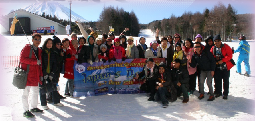
การสัมมนาและทัศนศึกษาต่างประเทศ ณ ประเทศญี่ปุ่น เมื่อวันที่ 3 - 7 มีนาคม 2558