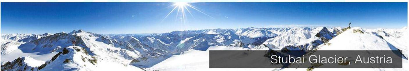
Stubai Glacier, Austria

จากนั้น นำท่านเดินทางสู่ "แคว้นทีโรล" (Tirol) อยู่ท่ามกลางล้อมของเทือกเขาแอลป์อันสูงตระหง่านและมีพื้นที่ใหญ่เป็นอันดับ 3 ของออสเตรีย เป็นเขตอนุรักษ์ธรรมชาติที่โดดเด่นและงดงาม (ระยะทางประมาณ 27 กิโลเมตร ใช้เวลาในการเดินทางประมาณ 30 นาที)