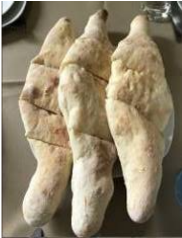
- คาชาปური ขนมหั่นหน้าชีสเยิ้มๆ

“Churchkhela” ขนมหวานทานเล่นที่ขึ้นชื่อ เป็นเม็ดถั่วทองถีนร่อยเข้าด้วยกันเป็นแถวยาวแล้วหุบด้วยแป้งเคียน้ำตาล