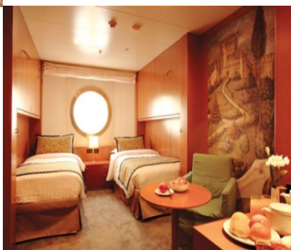
ห้องพักแบบมีหน้าต่าง ขนาด 16.6 ตารางเมตร