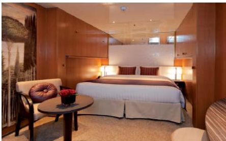
ห้องพักแบบไม่มีหน้าต่าง ขนาด 16.6 ตารางเมตร