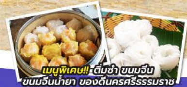
เมนูพิเศษ!! - ต้มยำ ขนอมจีน ขนอมจีนน้ำยา ของดินนครศรีธรรมราช