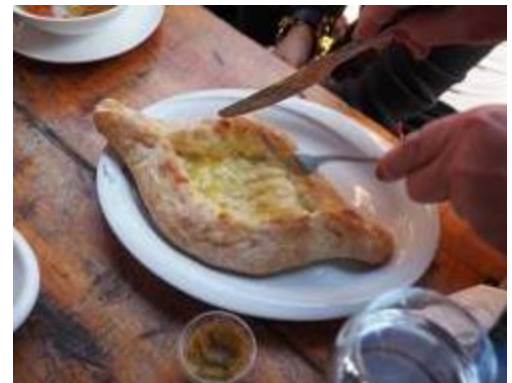
Acharuli เป็นขนมปังไข่ดาวซีท

“Khinkali” เป็นอาหารทานเล่นที่ทำมาจากเนื้อสัตว์ผสมเครื่องปรุงต่างๆ แล้วจึงห่อด้วยแป้งเหมือนเสีวหลงเป่าที่เราคุ้นเคย