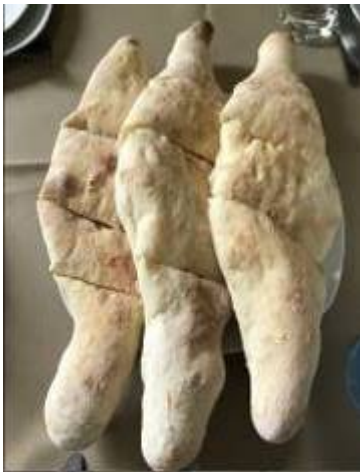
- คาซาปური ขนมปังหน้าชีสเยิ้มๆ

“Churchkhela” ขนมหวานทานเล่นที่ขึ้นชื่อ เป็นเม็ดถั่วทองถักร้อยเข้าด้วยกันเป็นแถวยาวแล้วชุบด้วยแป้งเคี้ยวน้ำตาล