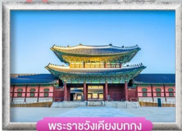
พระราชวังเคียงบกุง