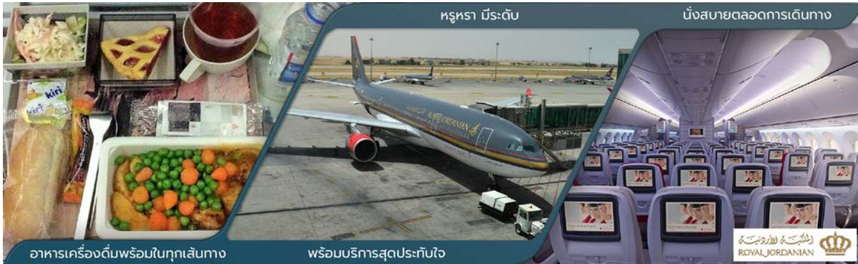
อาหารเครื่องดื่มพร้อมในทุกเส้นทาง

✈️ ออกเดินทางสู่ เมืองอัมมาน (AMM) โดยสายการบิน ROYAL JORDANIAN เที่ยวบินที่ RJ 181