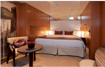
ห้องพักแบบไม่มีหน้าต่าง ขนาด 16.6 ตารางเมตร