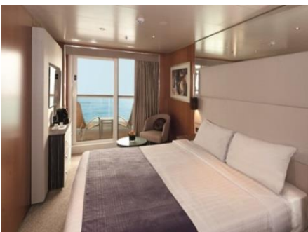
ห้องพักแบบมีระเบียง ขนาด 24.2 ตารางเมตร