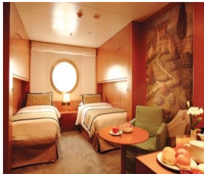
ห้องพักแบบมีหน้าต่าง ขนาด 16.6 ตารางเมตร