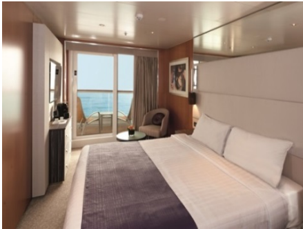
ห้องพักแบบมีระเบียง ขนาด 24.2 ตารางเมตร