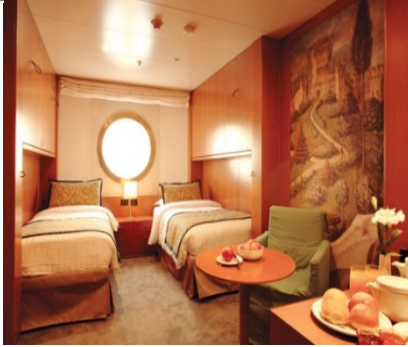
ห้องพักแบบมีหน้าต่าง ขนาด 16.6 ตารางเมตร