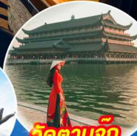
วัดตามจุก แลนด์มาร์กใหม่เวียดนาม