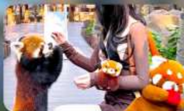
ให้อาหารแพนด้าแดง