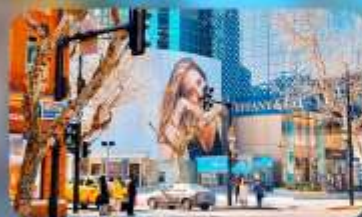
ถนนทวยไห่มีดเคิลไรด์