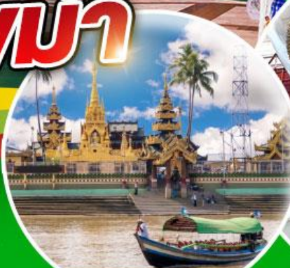
เจดีย์เยเลพญา