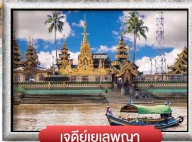
เจดีย์เยเลพญา