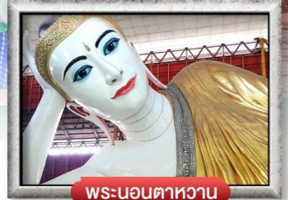
พระนอนตาหวาน

เมนู สุดพิเศษ | กุ้งแม่น้ำเผา + เปิดปอกกุ้ง + สลัดกุ้งมังกร