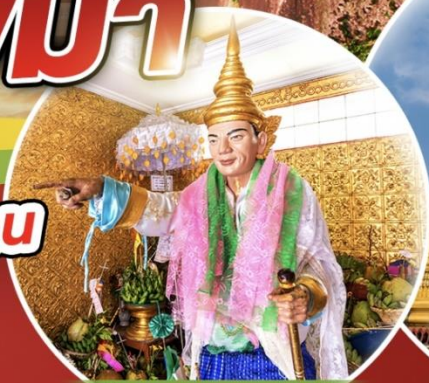
สักการะเทพทันใจ