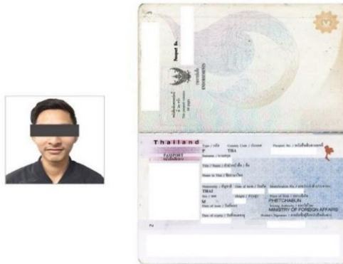
หมายเหตุ : สแกนสีเท่านั้น