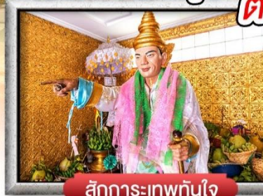
สักการะเทพทันใจ