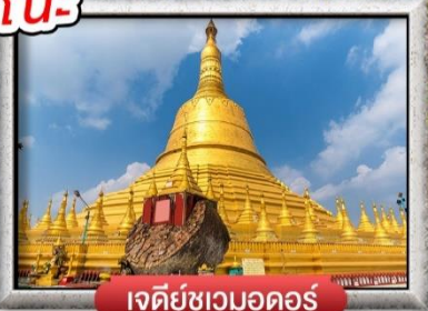
เจดีย์ชเวมอดอร์

เมนู สุดพิเศษ | กุ้งแม่น้ำเผา + บุฟเฟ่ต์นานาชาติ