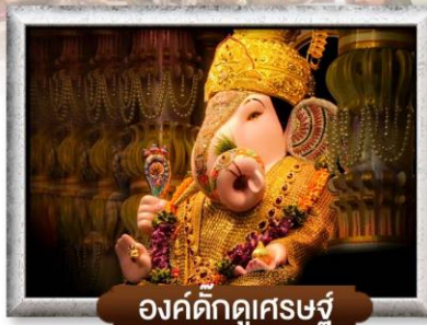
องค์ศักดิ์สิทธิ์