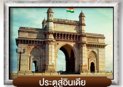
ประตูสู่อินเดีย