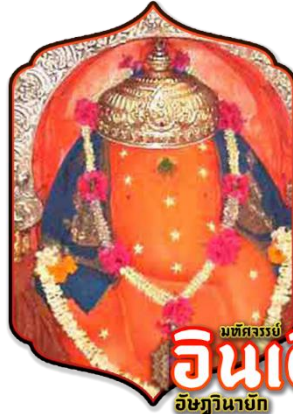
มณฑลธรรมย์ อินเดีย อัยภินายัก

เที่ยง ๑๒ บริการอาหารกลางวัน ณ ร้านอาหาร (มื้อที่ 5)