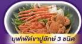
บุฟเฟ่ต์งาบุคิชิ 3 ชนิด