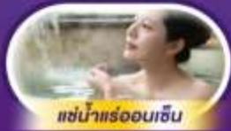
แช่น้ำแร่ออนเซ็น