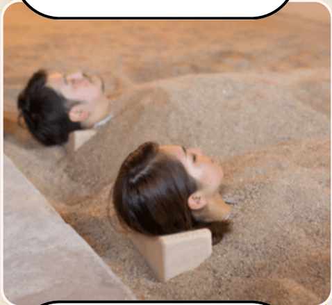
อาบทรายร้อน ระดับมิซลิน