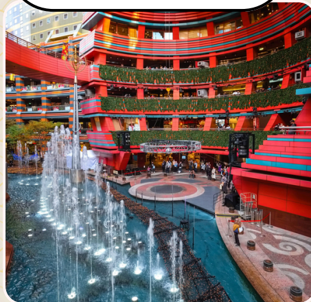
ช้อปปิ้ง ห้างคานาเนล ซิตี้