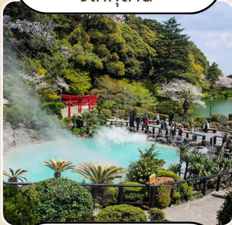
บ่อนรก จิโงกุตามิ