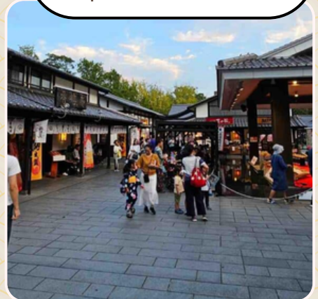
ศูนย์ช้อปปิ้งเมืองเก่า ซากุระ โนะ บาบะ โจโซเอ็น