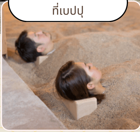
อาบทรายร้อน ที่เบปปุ