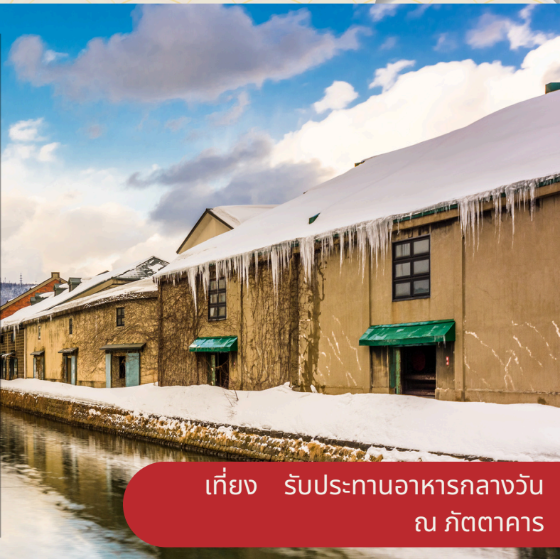
เที่ยง รับประทานอาหารกลางวัน ณ ภัตตาคาร

เดินทางสู่ เมืองโอตารุ (Otaru) เมืองเก่าผสมผสานความงดงามของธรรมชาติวัฒนธรรม และความทันสมัย พิพิธภัณฑ์กล่องดนตรีโอตารุ (Otaru Music Box Museum) เื่อลักษณะหนึ่งของโอตารุที่ต้องไม่พลาดมาชมกล่องดนตรีน่ารักๆ ถนนซาโคมะจิ แหล่งช้อปปิ้งที่โด่งดัง มีร้านค้า ร้านอาหาร ร้านกาแฟ ร้านขายของที่ระลึก รวมไปถึงร้านเสื้อผ้าต่าง ๆ มากมาย เหมาะสำหรับสายช้อปปิ้งสุด ๆ