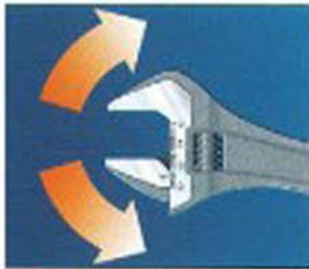
หัวประแจเลื่อนแข็งแรงทนทานต่อการใช้งานขึ้นได้ทั้งซ้ายและขวา