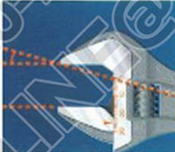
หัวประแจทำมุม 15 องศา ทำให้มีประสิทธิภาพในการทำงานและเข้าหันทึบมากขึ้น