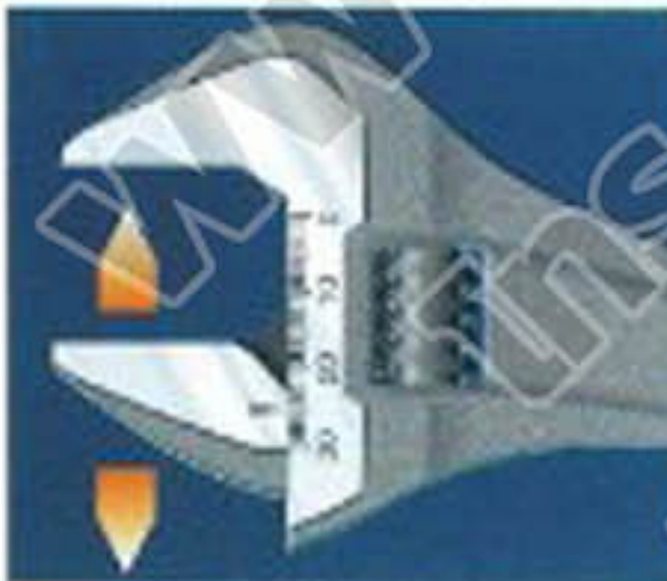
ประแจเลื่อนสามารถปรับขนาดปากตามที่ต้องการได้ช่วยแลกเปลี่ยนง่าย