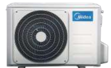
*เฉพาะขนาด 36K, 48K