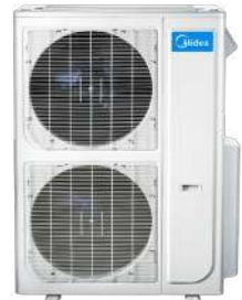
*เฉพาะขนาด 60K