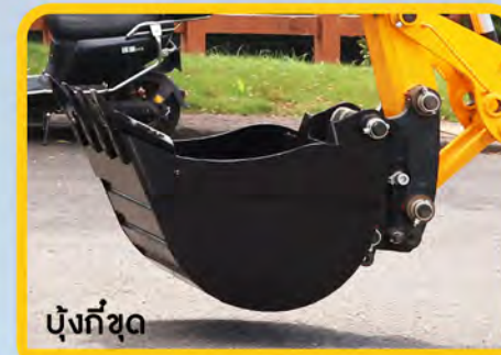
บั้งที่ขุด