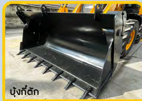
บั้งที่ตัก

ห้องคนขับกว้างขวาง สะดวกสบาย กระจกเปิดได้ 5 บาน -ระบบไฟส่องสว่างเป็นแบบ LED ติดตั้งด้านหน้า 6 ดวง และด้านหลังอีก 4 ดวง - หน้าจอแบบสัมผัส ทันสมัย สวยงาม มาพร้อมกับเมนูภาษาไทย ใช้งานง่าย - ที่นั่งแบบหมุนได้ นั่งสบาย ไม่เมื่อยล้าขณะทำงาน - จอยสติ๊ก แบบติดกับเบาะคนขับ ทั้งงานขุดและงานตัก ใช้จอยสติ๊กอันเดียวกัน พร้อมทั้งวางแขน จึงไม่ต้องเอี้ยวตัว ทำให้ไม่เมื่อยล้าขณะทำงานเป็นเวลานานๆ