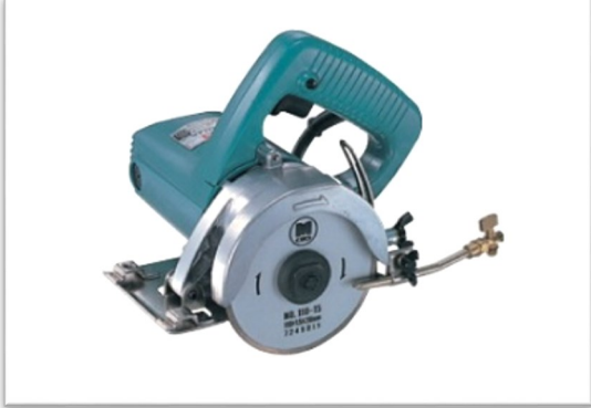
Model 4100 NB