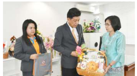
นางสาวอัญมณี ทิรสฤทธิ์ รองอธิบดีกรมตรวจบัญชีสหกรณ์