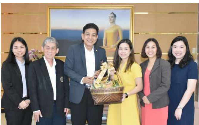
ผู้แทนจากบริษัทไทยรี ประกันชีวิต จำกัด