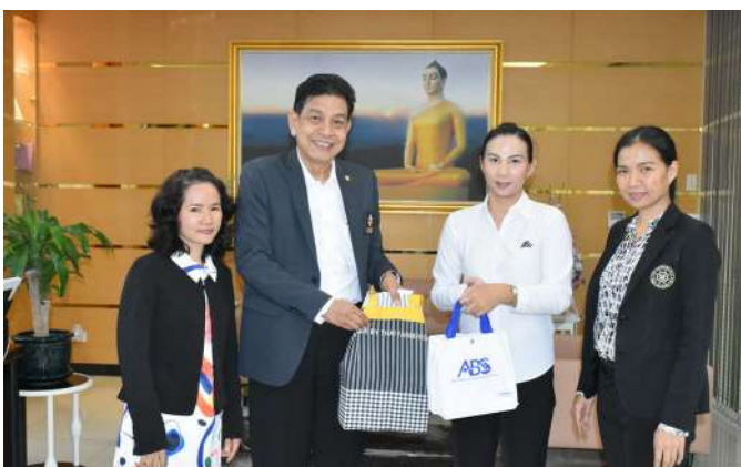
ผู้แทนจากบริษัท แอคซิวเรียลมิช จำกัด