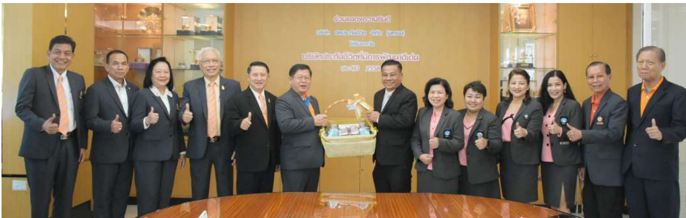
ผู้แทนจากชุมนุมสหกรณ์ออมทรัพย์แห่งประเทศไทย จำกัด

นอกจากนี้ สหประกันชีวิต ยังได้เปิดบ้านต้อนรับพันธมิตรทางธุรกิจและหน่วยงานต่าง ๆ ที่แวะเข้ามาพบปะ เยี่ยมเยียน พร้อมทั้งสวัสดิ์ปีใหม่ 2563 ถึงที่ทำการของบริษัทอีกด้วย