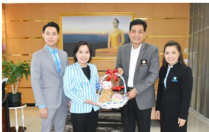
ผู้แทนจากบริษัท สยามสไมล์ โบรกเกอร์ จำกัด