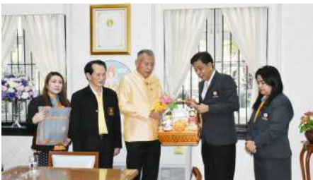
นายโอกาส ทองยงค์ อธิบดีกรมตรวจบัญชีสหกรณ์