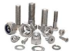
bolt & nut