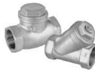
check & y-strainer