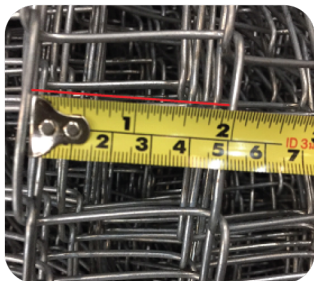
ตา 1 1/2" ทั่วไป วัดจริงได้ขนาด 1 นิ้ว 7 หุน (เกือบ 2 นิ้ว)

ขนาดของตาโรงงานที่ผลิตส่วนใหญ่จะทำมาใหญ่กว่าแบรนด์ไทเกอร์ โดยการสุ่มตัวอย่างทดสอบวัดจริงได้ขนาดตามนี้