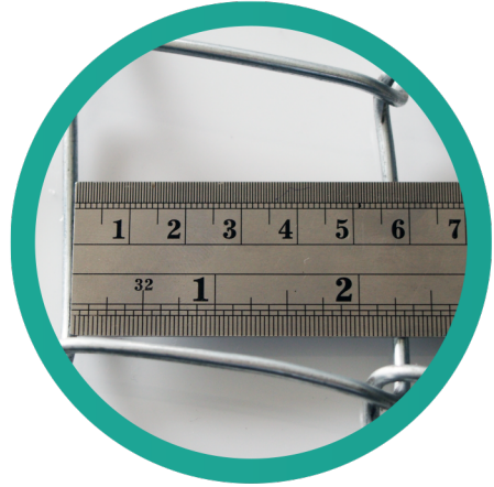
ตาทั่วไป ขนาด 2 นิ้ววัดจริงได้ 2 นิ้ว 2 หุน