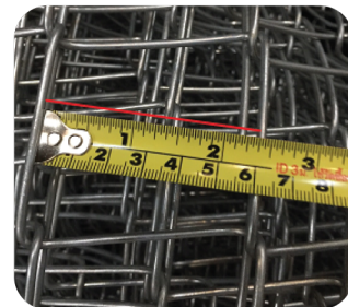
ตา 2" ทั่วไป วัดจริงได้ขนาด 2 นิ้ว 3 หุน (เกือบ 2 นิ้วครึ่ง)