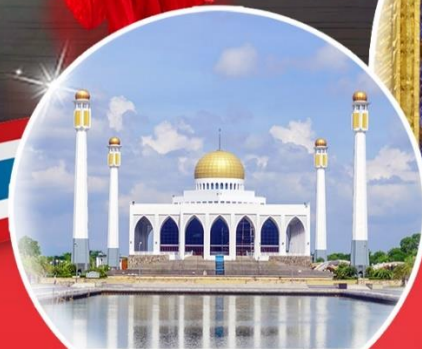
มัสยิดกลาง สงขลา