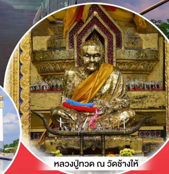
หลวงปู่ทวด ณ วัดช้างไห้