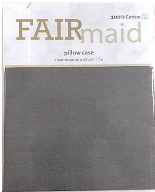
รูปที่ 1 : G 1247-1/64 ด้านหน้า

หมายเลขรายงานผล : G 1247/64 หมายเลขใบคำขอทดสอบ : - วันที่ออกรายงานผล : 04/01/64 หน้า : 2/2