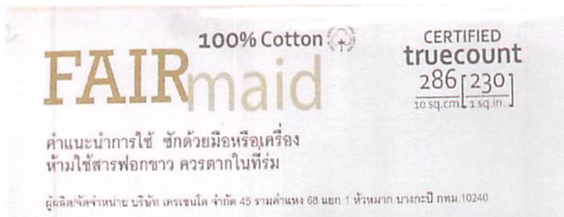
รูปที่ 3 : G 1247-1/64 ฉลากที่ระบุจำนวนเส้นด้าย