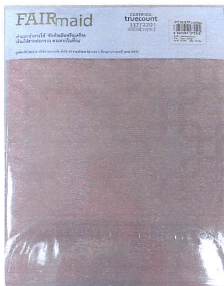
รูปที่ 2 : G 2683-1/64 ด้านหลัง