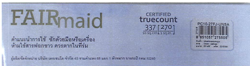
รูปที่ 3 : G 2683-1/64 ฉลากที่ระบุจำนวนเส้นด้าย