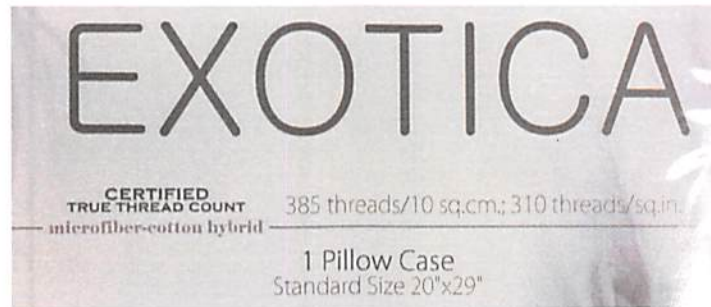
รูปที่ 3 : G 1246-1/64 ฉลากที่ระบุจำนวนเส้นด้าย