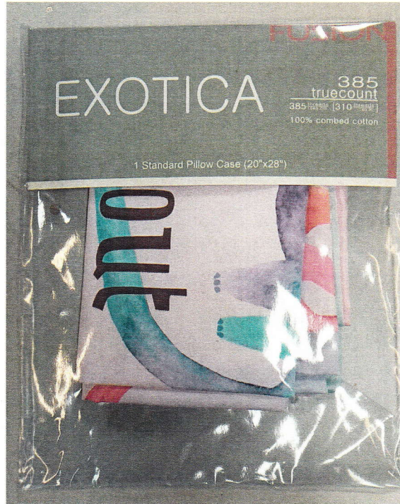
รูปที่ 1 : G 2286-1/62 ด้านหน้า

หมายเลขรายงานผล : G 2286/62 หมายเลขใบคำขอทดสอบ : 29618 วันที่ออกรายงานผล : ๐๖/๐๓/๖๒ หน้า : 2/2