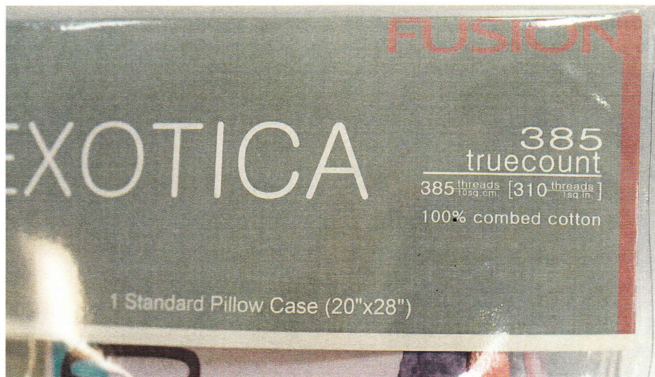
รูปที่ 3 : G 2286-1/62 ฉลากที่ระบุจำนวนเส้นด้าย