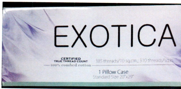
รูปที่ 3 : G 5612-1/63 ฉลากที่ระบุจำนวนเส้นด้าย