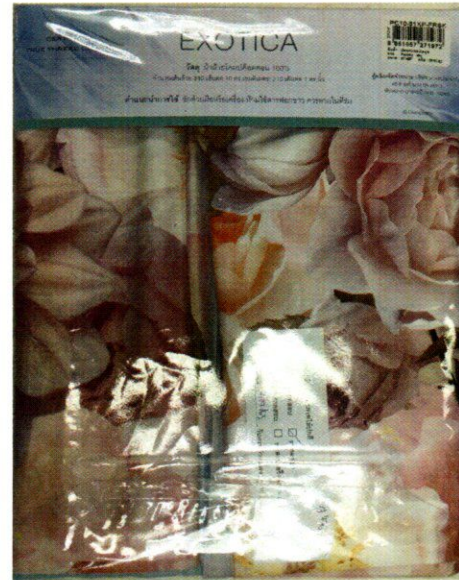
รูปที่ 2 : G 4763-1/63 ด้านหลัง