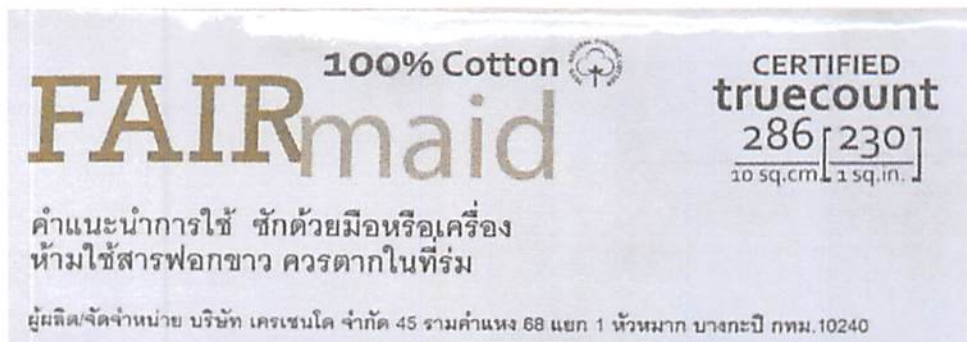
รูปที่ 3 : G 1189-1/64 ฉลากที่ระบุจำนวนเส้นด้าย