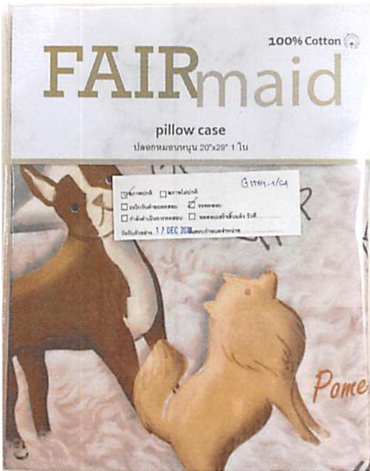
รูปที่ 1 : G 1189-1/64 ด้านหน้า

หมายเลขรายงานผล : G 1189/64 หมายเลขใบคำขอทดสอบ : - วันที่ออกรายงานผล : 24/12/63 หน้า : 2/2