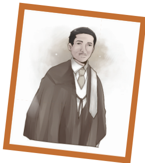
พระเจ้าบรมวงศ์เธอ พระองค์เจ้ารพีพัฒนศักดิ์ กรมหลวงราชบุรีดิเรกฤทธิ์ พระบิดาแห่งกฎหมายไทย

ในช่วงนั้น ได้เกิดทางแยกว่า ประเทศไทยควรเลือกใช้ระบบกฎหมายแบบไหนดีนะ เพราะว่าตอนนั้นมีให้เลือกอยู่สองระบบคือ ระบบกฎหมายลายลักษณ์อักษรที่มีประเทศฝรั่งเศส ฮอลันดาใช้ กับระบบกฎหมายจารีตประเพณีที่ประเทศอังกฤษใช้ แต่ท้ายที่สุดแล้วก็ได้เลือกระบบกฎหมายลายลักษณ์อักษร เพราะว่ามีการจัดระบบระเบียบเป็นหมวดหมู่ โดยตราออกมาเป็นประมวลกฎหมาย ซึ่งมีความเหมาะสมกับกฎหมายไทยมากกว่า และเป็นระบบเดียวกับประเทศส่วนใหญ่ที่เราจะต้องเจรจาเพื่อขอยกเลิกสิทธิสภาพนอกอาณาเขต ให้เรากลับมามีเอกราชทางการศาลได้อย่างรวดเร็ว ดังนั้น ประเทศของเราจึงเป็นประเทศที่ใช้ระบบลายลักษณ์อักษรที่เน้นการนำเอาประมวลกฎหมายที่บัญญัติขึ้นมาปรับใช้กับคดีเป็นหลัก ไม่ใช่จารีตประเพณีค่ะ