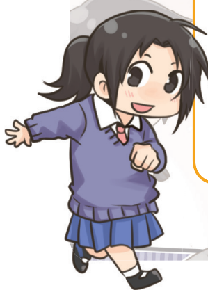
เคียวโกะ