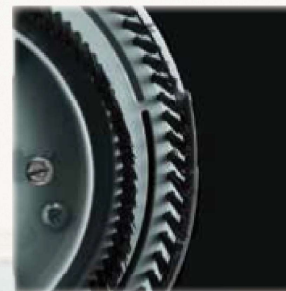
แปรงสองแถวช่วยขัดขจัดฟุ้ง และสิ่งสกปรกออกจากพื้นสระ