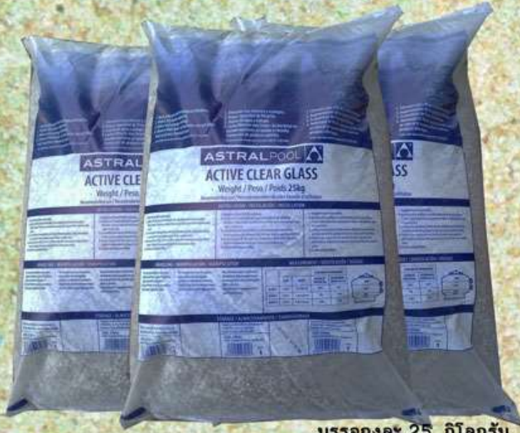
บรรจุถุงละ 25 กิโลกรัม