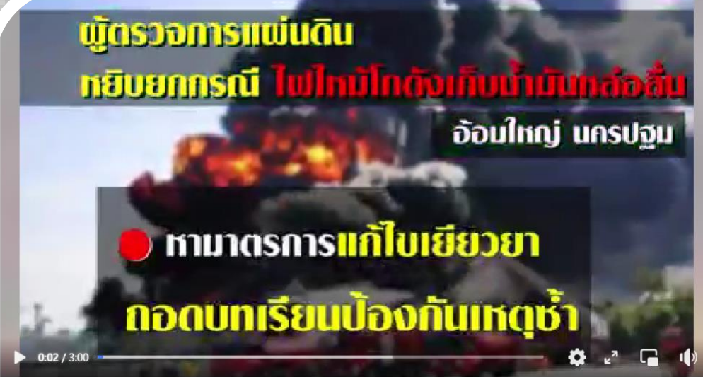
...ผู้ตรวจการแผ่นดินทียบยก กรณี ไฟไหม้โกดังน้ำมันหลอสน ออมใหญ่ จังหวัดนครปฐม แก๊ซ เขียวยาความเดือดร้อนให้ประชาชน สร้างมาตรการป้องกันเหตุซ้ำ