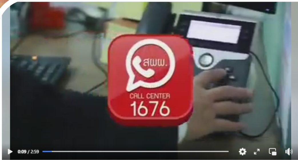
สำนักงานผู้ตรวจการแผ่นดิน สายด่วน Call Center 1676 ร้องเรียนการปฏิบัติราชการของหน่วยงานรัฐหรือเจ้าหน้าที่ของรัฐ