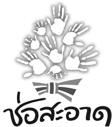
การใช้งานสัญลักษณ์ชนิดสีเดียว บนพื้นหลังสีขาว