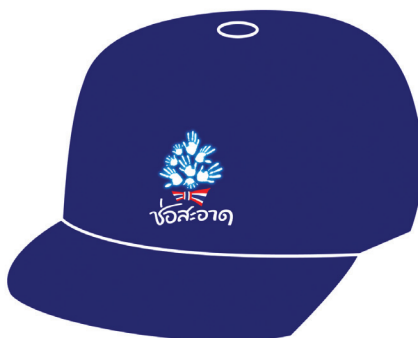
สัญลักษณ์บนหมวกพื้นขาว และหมวกพื้นสี