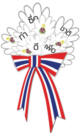
ของที่ระลึกจากสัญลักษณ์