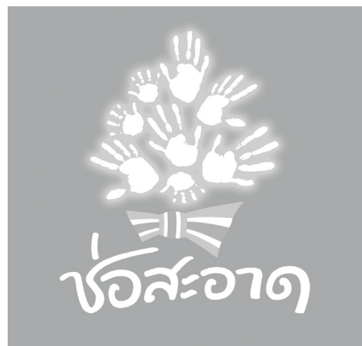
การใช้งานสัญลักษณ์ชนิดสีเดียว บนพื้นหลังสีพิเศษทอง-เงิน