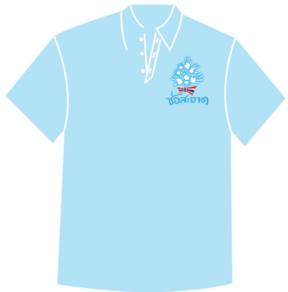
สัญลักษณ์บนเสื้อพื้นขาว และเสื้อพื้นสี