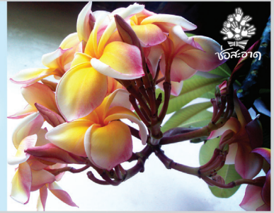
สัญลักษณ์สีเดียวบนสื่อ