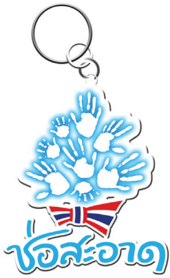
สัญลักษณ์บนพวงกุญแจ