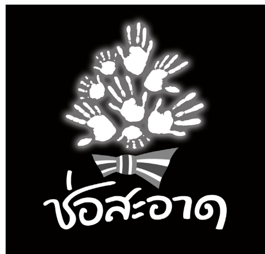
การใช้งานสัญลักษณ์ชนิดสีเดียว บนพื้นหลังสีฟ้า และสีดำ