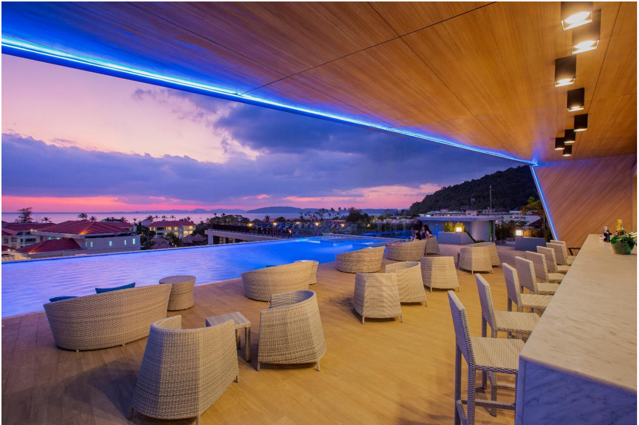
Main Swimming Pool