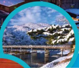
สะพานโทเก็ตสึ