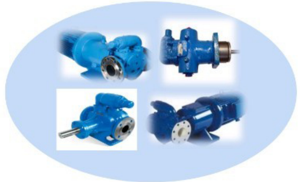
ปั๊มน้ำมันสำหรับคอมเพรสเซอร์/OIL PUMP