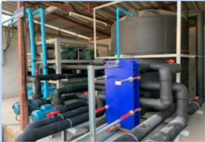
เครื่องผลิตน้ำเย็น(น้ำทะเล) / WATER CHILLER (SEA WATER)