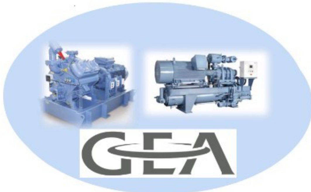
เกียร์ คอมเพรสเซอร์ชนิดลูกสูบและสกรู GEA Refrigeration Compressor