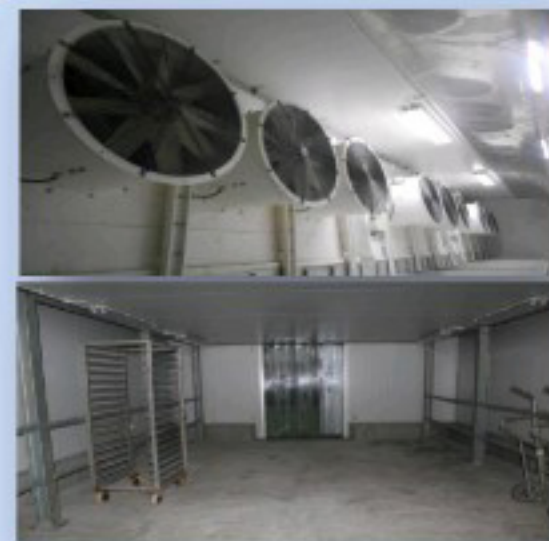
ห้องแช่แข็งชนิดลมเป่า / Air blast freezer