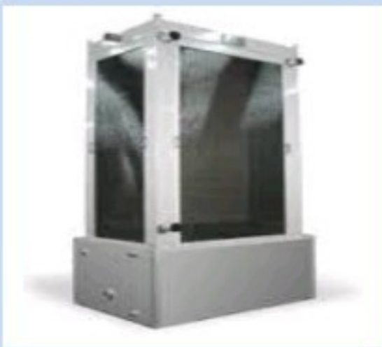
เครื่องผลิตน้ำเย็น / FALLING FILM CHILER