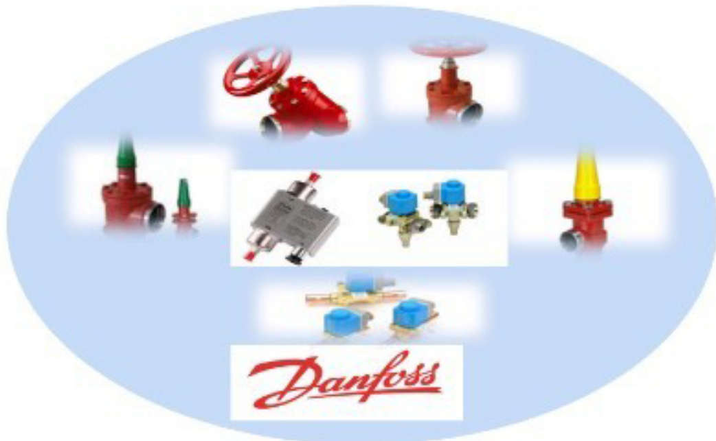
วาล์วสำหรับระบบทำความเย็น ฟร็อนและแอมโมเนีย