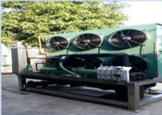
เครื่องผลิตน้ำเย็น / WATER CHILLER