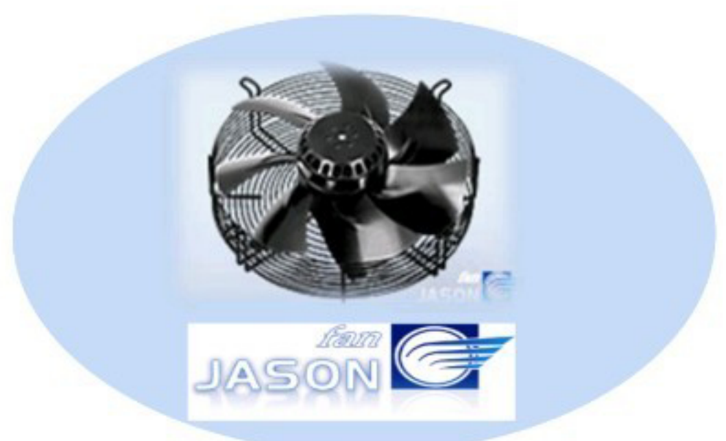
พัดลมสำหรับชุดระบายความร้อน / คอนเดนเซอร์