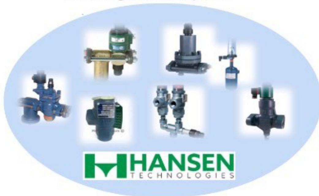
HANSEN วาล์วแอมโมเนีย / HANSEN Ammonia valve