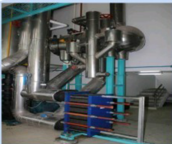
ชุดทำน้ำเย็นสำหรับระบบปรับอากาศ GLYCOL SYSTEM