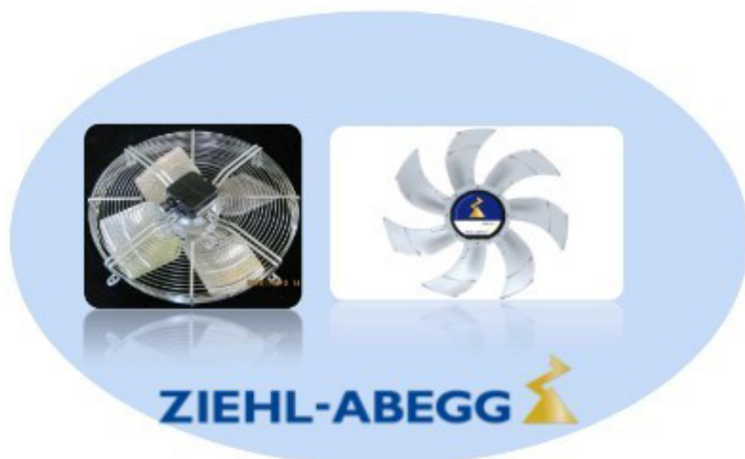
พัดลมสำหรับคอยล์เย็นชนิดลมเป่า