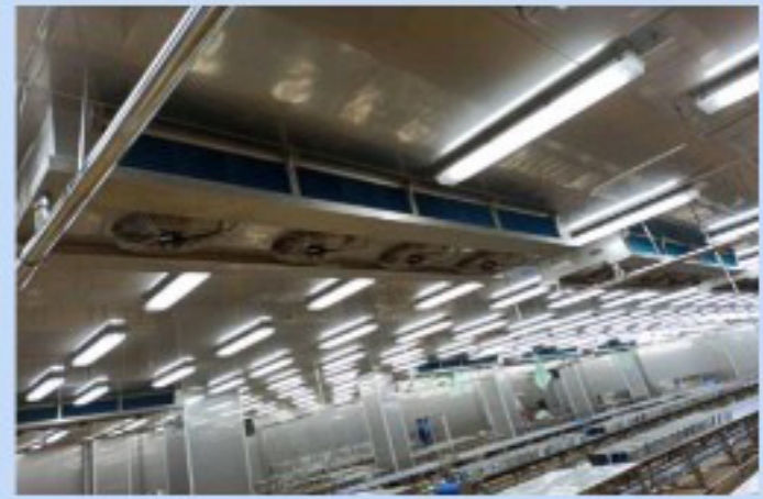
เครื่องปรับอากาศสำหรับไลน์การผลิต / PRODUCTION ROOM