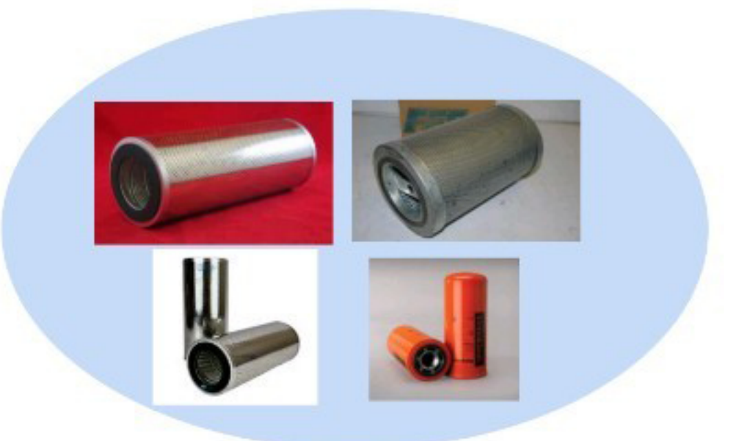
OIL FILTER AND COALESCER ELEMENT