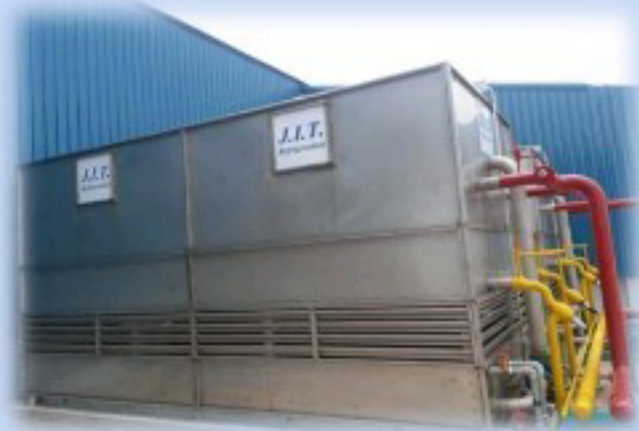
เครื่องระบายความร้อนสำหรับเครื่องทำความเย็น EVAPORATIVE CONDENSER