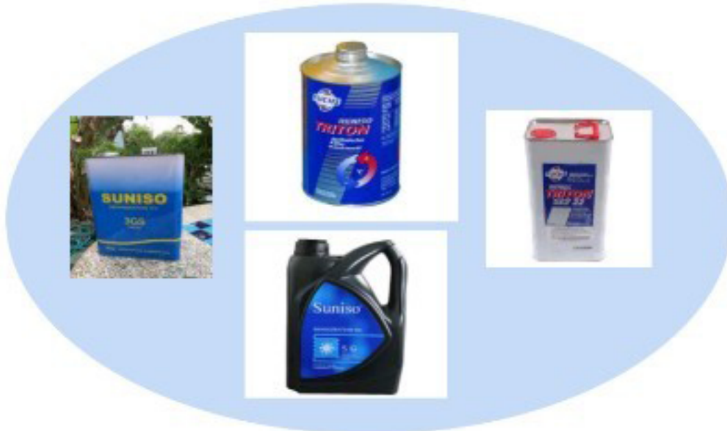
น้ำมันคอมเพรสเซอร์ สำหรับ R-22 , R-404A