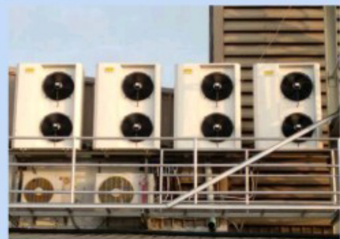
เครื่องทำความเย็นขนาดเล็ก / HERMETIC CONDENSING UNIT