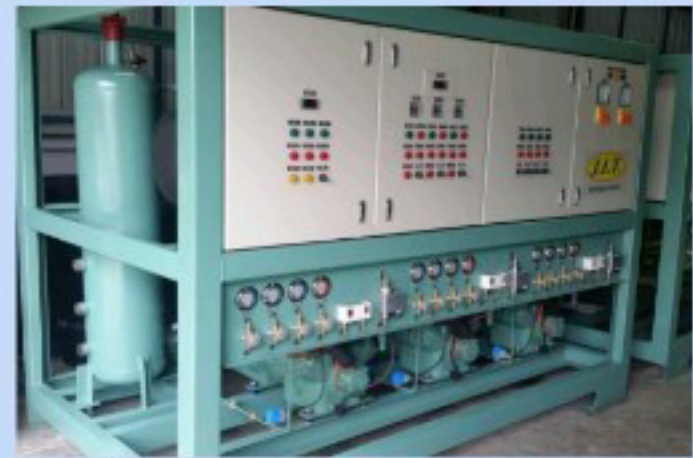
ชุดคอมเพรสเซอร์ / J.I.T. COMPRESSOR RACK