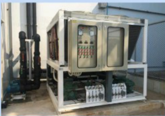
เครื่องทำน้ำเย็นไกลคอน / GLYCOL CHILLED SYSTEM