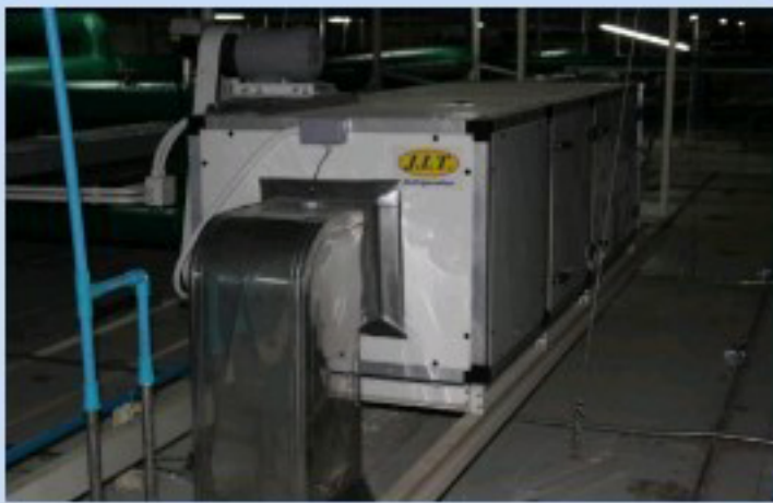
เครื่องปรับอากาศ เดิมอากาศ / FRESH AIR SYSTEM