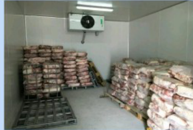
ห้องเย็นขนาดเล็ก / COLD ROOM