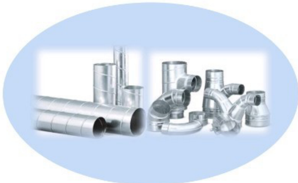
ท่อส่งลมและอุปกรณ์ / AIR DUCT