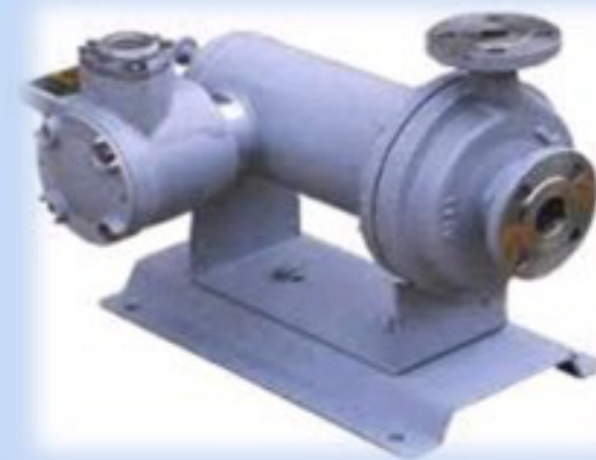
ปั๊มแอมโมเนีย / Ammonia Pump