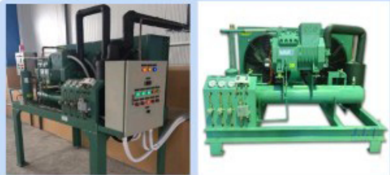
ชุดคอมเพรสเซอร์ / AIR COOLER CONDENSING UNIT