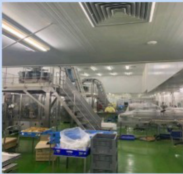
ห้องปรับอากาศความดันบวก / POSITIVE PRESSURE ROOM