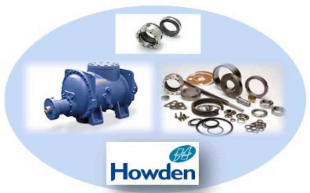
Howden Screw Compressor / Spare parts