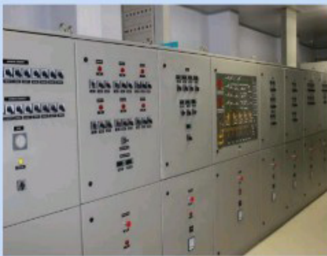
ตู้ไฟฟ้าควบคุมเครื่องเย็น / Electric control