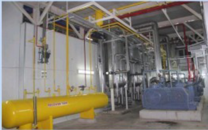
ห้องคอมเพรสเซอร์สำหรับระบบแอมโมเนีย COMPRESSOR ROOM FOR AMMONIA SYSTEM