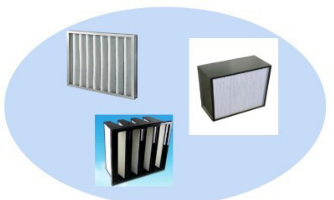
กรองอากาศ PRE FILTER , MEDIUM FILER , HEPA FILER