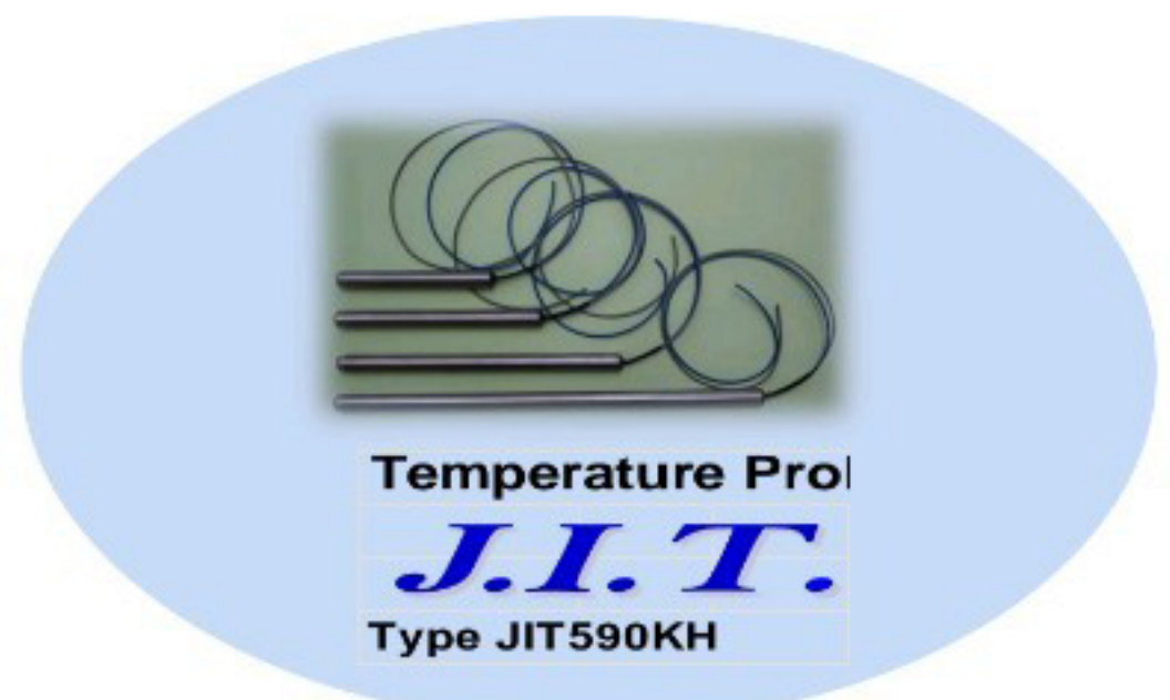
โพรบ วัดอุณหภูมิปลอกสแตนเลส