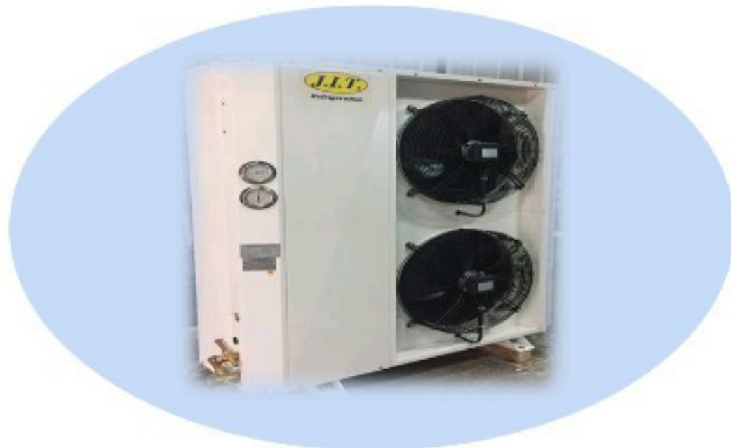
คอนเดนเซอร์สำหรับเครื่องเป็นขนาดเล็ก / SCROLL COMPRESSOR