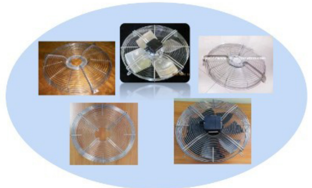
ตะแกรงพัดลมสำหรับคอยล์เป็นสแตนเลส