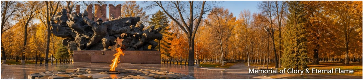
Memorial of Glory & Eternal Flame