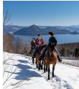
Horse Riding, Toya Course