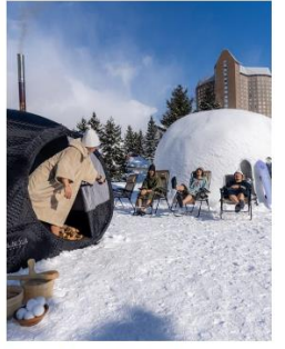
Tent Sauna & Kamakura outdoor snow dive