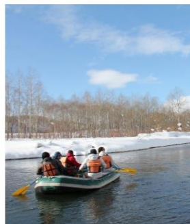
Winter River Trip